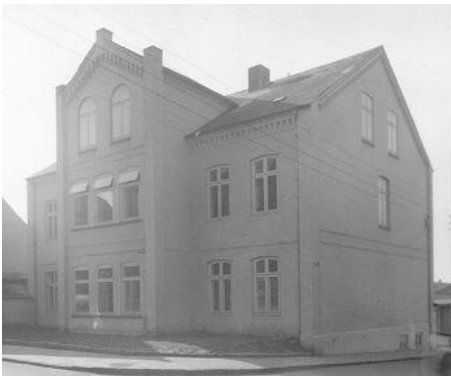
Den tyske skole frem til 1973 på hjørnet af Nygade og Ringgade i Gråsten. (B1450 Gråsten lokalarkiv)

Først i 1955, 10 år efter krigens afslutning, får mindretallet muligheder for at leje sig ind i en ejendom på hjørnet af Ringgade og Nygade. Indtil da måtte elever med tysk baggrund søge mod den tyske skole i Sønderborg for at kunne komme i skole eller gå på den almindelige folkeskole i Skolegade, senere Degnevænget. Det fortæller os, at det ikke har været så nemt at skulle træffe et skolevalg.