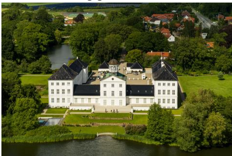
Gråsten slot. (Sønderborg kommune)

På vandreturen gennem byen kommer man hurtigt ned til slotssøen og til højre ligger Gråsten slot med parken, slotskirken og den tilknyttede kongelige køkkenhave. Det er klart den smukkeste tid fra forår til sent efterår at gå gennem haverne, hvis man skal planlægge en vandretur. Der er så meget at fordybe sig i arkitektonisk, historisk og i forhold til havebrug. Selve slottet er opført i 1759 og er lukket for besøgende, men man kan med respekt for stedet vandre gennem haverne og videre ud i skoven eller til Den kongelige Køkkenhave. Slotskirken anvendes i dag lokalt og som bekendt gæster kongefamilien hver sommer stedet. Når dette sker, er haven lukket for besøgende.