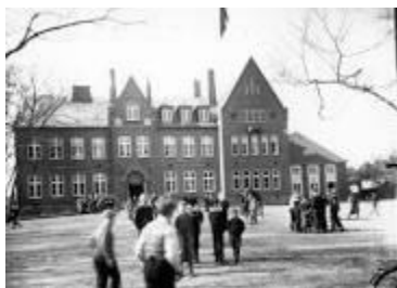
Gråsten skole.

I 1875 blev der oprettet en tysk privatskole i byen, hvor både tyske og danske familier kunne sende deres børn hen. Skolesproget her var tysk og formålet var klart en forberedelse til mere end almueskolen. Således blev skolegangen en forberedelse til enten videre skolegang i Flensborg eller Sønderborg. Der var helt klart stor forskel på by og land. Den første tyske privatskole hed dengang Kanninekskole og lå i Fredensgade, tidligere Havnegade. I 1920 efter Genforeningen bliver skolen i Skolegade udviklet, tilbygget og flyttet længere ud, hvor den ligger nu som dansk folkeskole. Den store udbygning til Degnevænget fra Skolegade skete i 1958.