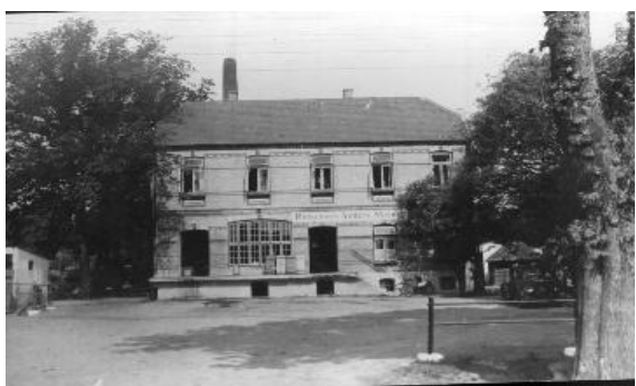
Billedet her er fra Rinkenæs Andelsmejeri ca. 1950.