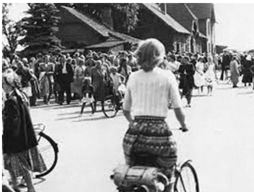
Billedet viser borgere fra Gråsten, der i 50'erne samles ved stationen i Gråsten ved kongeparrets ankomst.

Den store stationsbygning blev ligeledes bygget i 1899 og betjente Tinglev-Sønderborgbanen. Her var der ventesale og særlige ventesale, kaldet fyrstesalen for hertugen af Gråsten Slot og senere de kongelige familier i Danmark. Salen blev renoveret i 1948 til Kong Frederik d.9. og Dronning Ingrid, som benyttede toget, når de skulle på sommerophold i Gråsten. De er dog ikke benyttede i dag, men er overgået til Sønderborg kommune og Turistkontor i 2018. I 1923 anlagdes en ny havn i Gråsten og således blev stationen nu også havnebane.