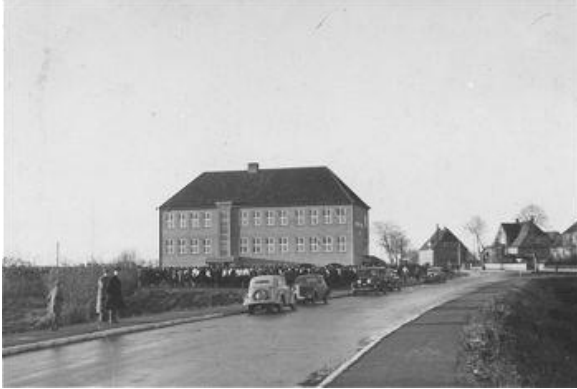
Den tyske skole på Kongevej 1941-1945.

Under Besættelsen blev den nye tyske skole bygget 1941-1942 og den kom til at ligge ikke så langt fra Banegården på Kongevej. En arkitektonisk flot bygning, som senere blev beslaglagt i 1945 ved krigens slutning og omdannet til retsbygning og politigård. I 2015 blev bygningen desværre revet ned og kan ikke længere ses. Men vandreruten passerer lige forbi.