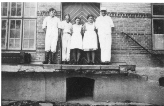
Billede af mejeriarbejdere.

Hvert eneste lille sogn havde et mejeri, men opfindelsen af centrifugalkraften (til kærning) betød, at man samlede flere små mejerier i andelsmejerier. Rinkenæs Andelsmejeri, tæt på Gråsten, var et af dem. På billedet ses både mejeribestyrer og flere ansatte stå på hovedtrappen.