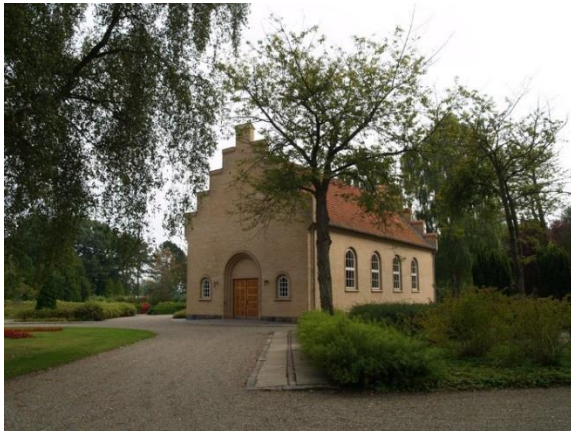
Gråsten kapel.

På vandreturen passerer vi forbi Gråsten Kirkegård og kapel. Vi anbefaler at tage en lille rundtur på kirkegården, fordi den rummer både historiske og botaniske oplevelser.